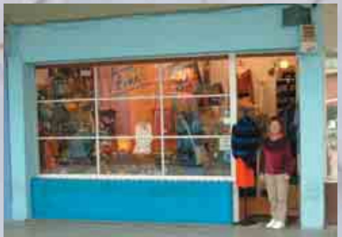
Arriba, Bakailuak y abajo Ttirri son establecimientos que llevan muchos años en La Visera. Aseguran que es un sitio privilegiado.

La peculiaridad del lugar y estratégica situación son los máximos atractivos de la Visera